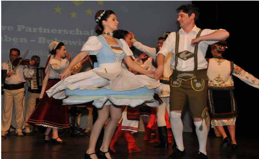
Die Bukowinische Tanz- und Musikgruppe Ansambul artistic „Ciprian Porumbescu“ sorgte für Unterhaltung