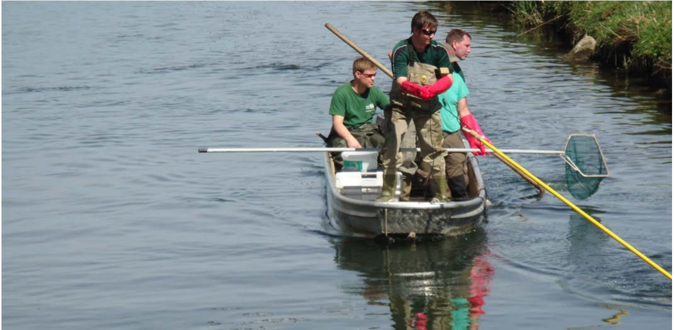
Wer die schwäbische „Unterwasserwelt“ kennenlernen will, der ist beim Tag der offenen Tür am 25. Juni in Salgen richtig.

Die heimische Fisch- und Gewässerwelt kennenlernen, eine Bachsafari mitmachen oder einfach einen interessanten Tag genießen – diese Möglichkeiten bietet sich beim Tag der offenen Tür im Schwäbischen Fischereihof Salgen. Die Einrichtung öffnet dafür am Sonntag, 25. Juni, von 10 bis 17 Uhr ihre Pforten. Angeboten werden auch Führungen durch den Lehr- und Beispielbetrieb. Heimische Fische, viele davon gefährdet, lassen sich in den Schau-Aquarien und in den Teichen des Fischereihofes beobachten. Und vor allem für die jüngeren Besucher interessant sind die Bachsafaris, die in den Lebensraum Gewässer einführen. Natürlich ist auch für das leibliche Wohl gesorgt, so werden kalte Räucherfischspezialitäten angeboten. Eine der zentralen Aufgaben des Schwäbischen Fische-