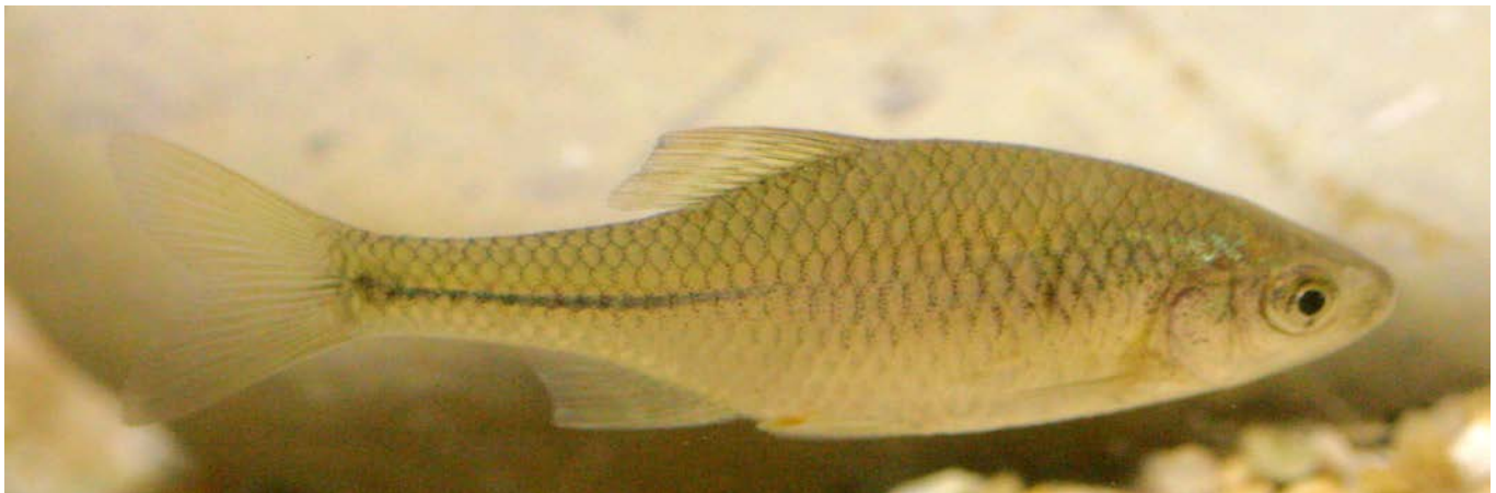
Der Bitterling ist in Gefahr.

Die Bezirks-Info stellt in losen Abständen gefährdete Fische aus Schwaben vor. Im April war es die Äsche und in dieser Bezirks-Info ist es der Bitterling. (Rhodeus amarus)